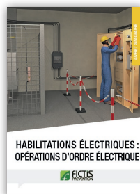
Livret habilitations électriques : opérations d'ordre électrique