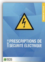
Carnet de prescription de sécurité électrique