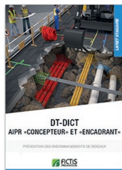
Livret DT-DICT AIPR « concepteur » et « encadrant »