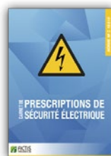
Carnet de prescription de sécurité électrique