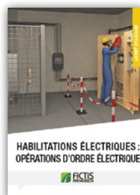
Livret habilitations électriques : opérations d'ordre électrique