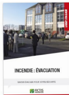
Livret «Incendie : Évacuation»